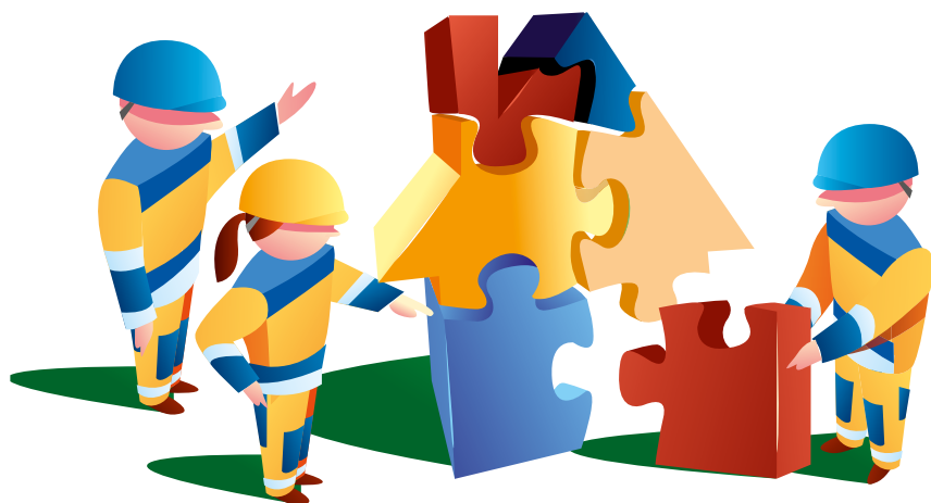
Figur 3: För att lyckas krävs samarbete och kommunikation.

Utvecklingen av ett standardiserat arbetsmoment är väl etablerat i många företag, särskilt inom så kallad fast industri (verkstad, fabriksproduktion