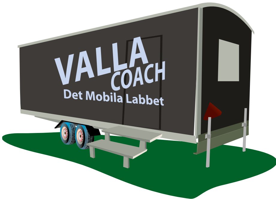
Figur 1: VALLA-boden som en illustration av ett produktionslabb för byggarbetsplatsen.

– nu fokuserar vi på att öka produktivitet och säkerhet i byggprojekt