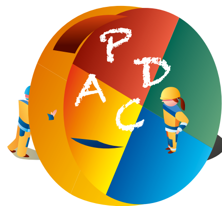
Figur 7: Planera (Plan) – Gör (Do) – Följ upp (Check) – Agera (Act) – loopen för ständig förbättring.

Mätningar och uppföljningar är en förutsättning för att kunna förbättra, liksom vikten av att inkludera och göra