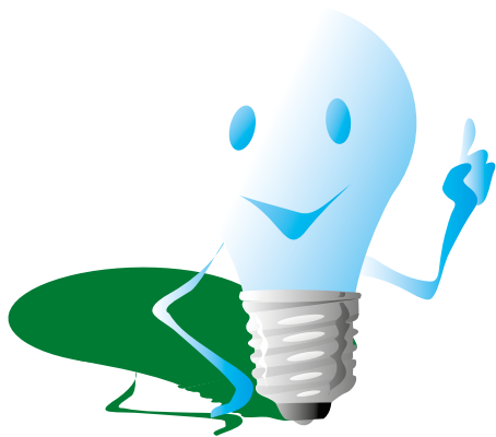
Figur 5: Idéer och reflektioner – grunden till lärande och utveckling.

etcetera). Med den kunskapen sammanfattades som en del av VALLA Coach en metod för att utveckla ett arbetssätt med standardiserade arbetsmoment, se figur 4. I beskrivningen av en standard är en av de viktigaste beståndsdelarna att ha fakta för hur lång tid ett moment tar – mätning blir därmed en viktig start i arbetet med en ny standard.