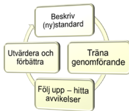
Figur 4: Process för att utveckla standardiserade arbetsmoment.

”Standardisering av arbetssätt och arbetsmoment är en nyckel för att leda byggbranschen mot en mer industrialiserad process. Förutsättningen för att lyckas med det är att skapa delaktighet och